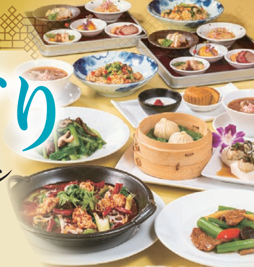
*写真は「涼夏コース」のイメージです。